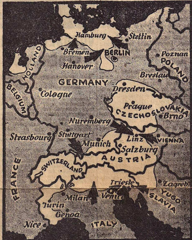
Het front op Woensdagavond 2 Mei.