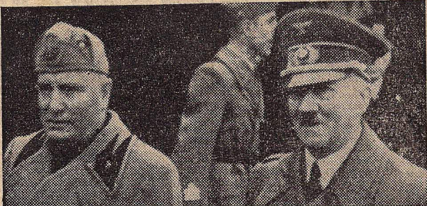
DAS WAR EINMAL—DAS KOMMT NIE WIEDER!

Een klein gedeelte van de oplaag van deze Vliegende Hollander wordt verspreid boven bevrijd gebied. Bevrijde landgenooten—geeft dit nummer zoo snel mogelijk door. Anderen willen ook de foto's zien!