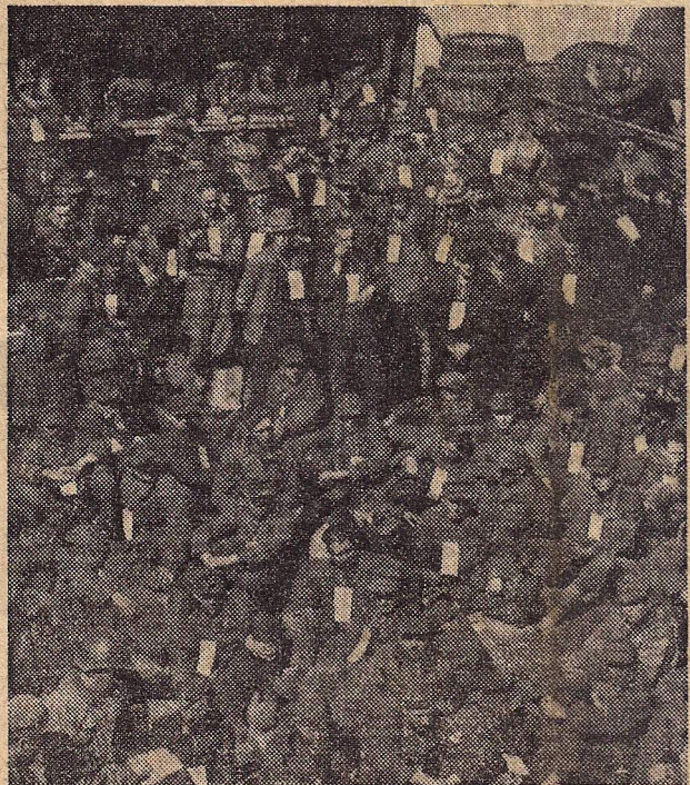
In April gaven zien in het Westen anderhalf miljoen Duitschers over. Op bovenstaande foto rust de Volkssturm uit van de doorstane emoties.

Slechts enkele weken geleden begonnen het 5e en 8e leger onder het Opperbevel van Veldmaarschalk Alexander de briljante veldtocht, die geleid heeft tot deze totale Duitse nederlaag.