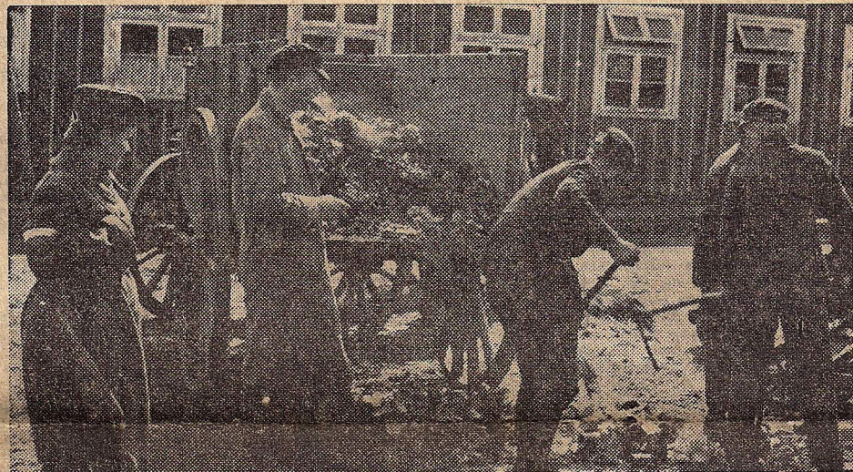
In het interneeringskamp van Poolse vrouwen, vlak bij de Duitsch-Nederlandsche grens, worden Duitse burgers gedwongen, groote schoonmaak te houden. De Poolse vrouwen waren gevangengenomen na den heroischen strijd in Warschau.

Het Alg. Ned. Persbureau meldt dat de onderhandelingen hebben plaats gehad in een dorp, gelegen tusschen de Canadeesche en Duitse linies.