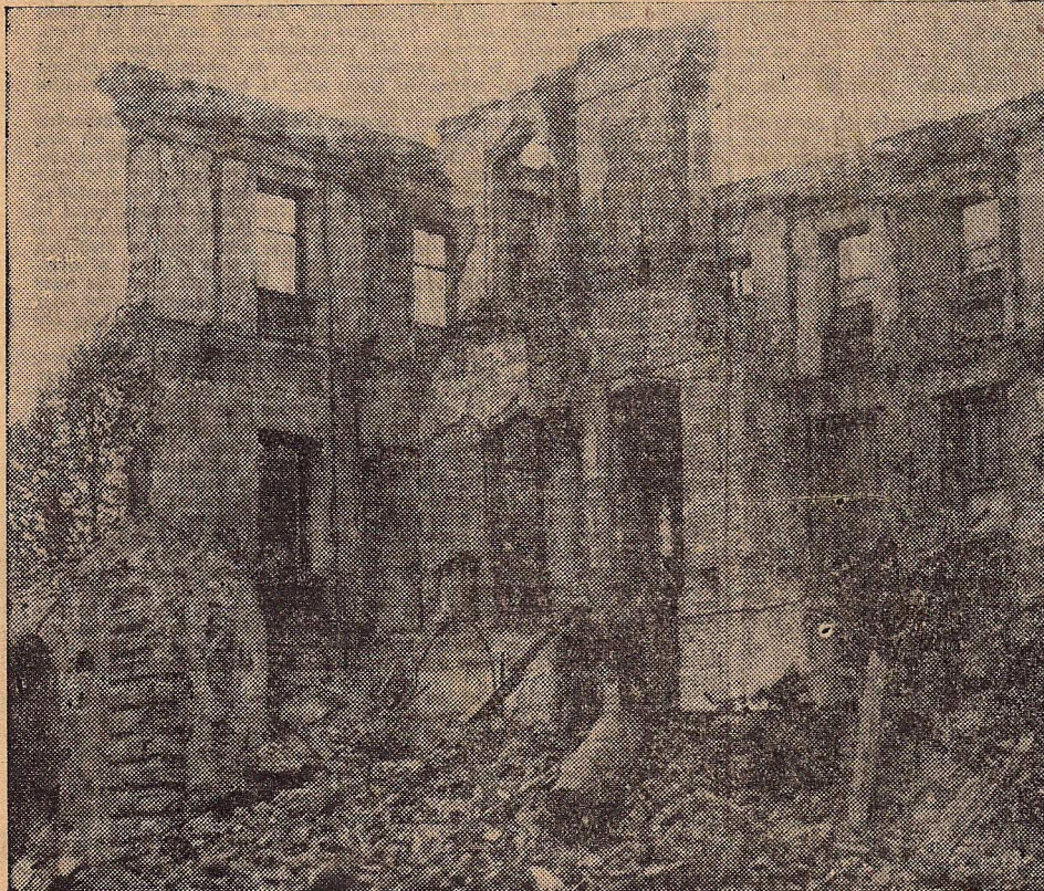
Beneden: Het stoffelijk overschot van das braune Haus , het hoofdkwartier van de Deutsche Nazipartij. Een voltreffer heeft het grootendeels vernield, welsprekend antwoord op Goerings uitroep, dat nimmer een bom zou vallen op eenige Duitsche stad. Het kwaad is uitgebrand—en Duitschland ligt in puin. Het duizendjarig Rijk is te gronde gegaan. Wat duizend jaar zal duren, is de echo van zijn val.