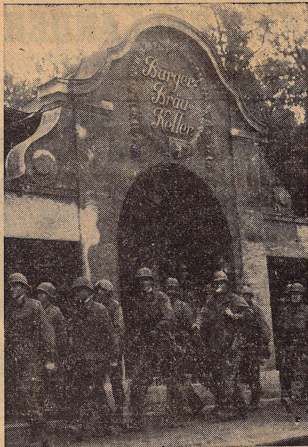
Sic transit gloria mundi! —Nadat München door de Amerikanen was veroverd, trokken hun troepen langs den ingang van den Bürgerbräukeller waar, meer dan twintig jaar geleden, het kwaad zijn loop begon. Eens daverden de muren van Hitlers oratorische effecten. Nu weerkaatsen zij den tred van Amerikaansche legers.