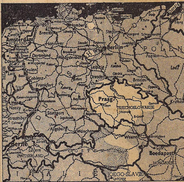
De laatste resten van het Derde Rijk, Zondagavond 6 Mei (Observer).

"Landgenooten, wij houden thans den blik gericht op de toekomst, waarin onder den zegen van den Allerhoogste, Nederland zal herrijzen en zijn hooge roeping in de wereld vervullen."