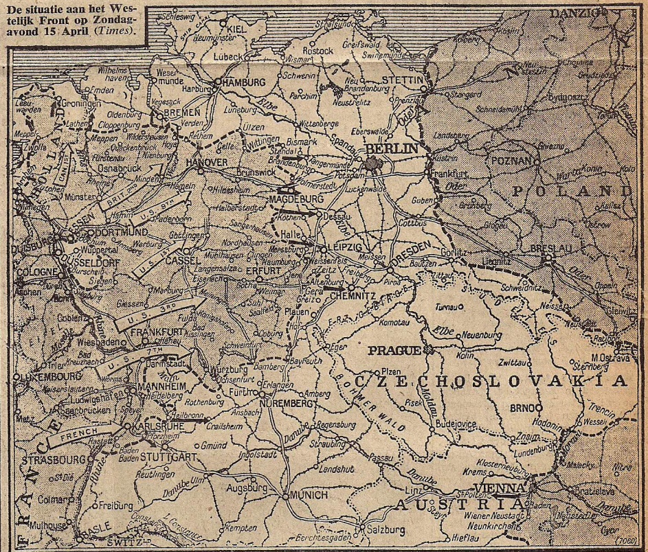
De situatie aan het Westelijk Front op Zondagavond 15 April (Times).

door. Er was sterke Duitsche tegenstand.