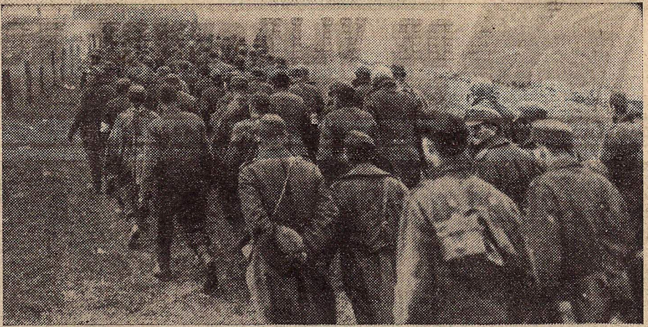
Een klein deel van de 540.000 Duitschers die, het hopeloze van verderen strijd beseffend, in de eerste twee weken van April capituleerden aan het Westelijk Front.

President Truman die j.l. Donderdagmiddag te Washington werd beëdigd als 32ste President van de Vereenigde Staten, is 61 jaar oud. Hij werd geboren op een boerderij in den staat Missouri, en diende in den eersten Wereldoorlog als majoor in het Amerikaansche leger. In 1934 werd hij gekozen tot lid van den Amerikaanschen senaat, in welke functie hij in 1940 herkozen werd. Tijdens den oorlog maakte hij naam als voorzitter van de Truman-commissie uit den Senaat, die verspilling in de Amerikaansche oorlogseconomie tegenging. Vorig jaar werd hij door de democratische conventie, gekozen als partij-candidaat voor het vice-presidentschap, in plaats van Henry Wallace. Volgens de Amerikaansche constitutie werd hij automatisch president, bij het verscheiden van Roosevelt. Truman is gehuwd, en heeft een dochter. Hij wordt beschouwd als een harde, consciëntieuze werker.