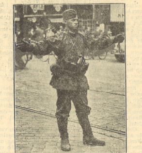
Een Duitse soldaat als verkeersagent op den Amstelveenscheuw.