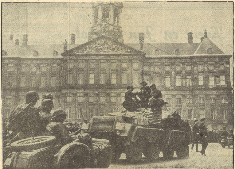
Een gemotoriseerde afdeling voor het den Dam.

ROTTERDAM, 15 Mei. — Rotterdam heeft dringend behoefte aan levensmiddelen, voor direct gebruik gereed, vooral ook aan melk. Zendt uits met levensmiddelen naar het administratiegebouw Electriciteitsbedrijf Ro- cussenstraat 200. Voorts zenden men aan het- zelfde adres verbandartikelen, materiaal voor technische diensten, opruimingsmateriaal, plan- ken, balken, spijkers, schoppen, hamers, hou- weelen, enz. (A.N.P.)