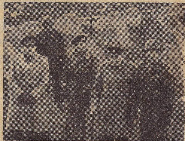
Enige dagen geleden heeft Churchill een bezoek gebracht aan het front in West-Duitsland en daarbij een kijkje genomen in de Siegfriedlijn. Van links naar rechts Sir Alan Brooke, chef van den staf van het Britsche Wereldrijk, veldmaarschalk Montgomery, Minister-President Churchill en generaal Simpson, commandant van het Amerikaansche 9e leger.

De twee bruggen bij Wezel zijn nog steeds niet geheel vernield, hoewel zwaarbeschadigd. Tusschen Wezel en Bonn staat geen enkele brug meer.