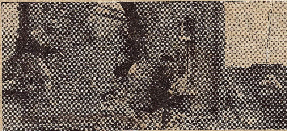
Stratengechten in Xanten, ten N.W. van Wezel. Soldaten van het Canadeesche 1e leger in actie.

• Bijna 24.500 vaartuigen van verschillend type en meer dan 28.500 vliegtuigen zullen er dit jaar voor de Amerikaansche marine worden gebouwd. Naar schatting zal ongeveer 90% hiervan worden gebruikt voor den strijd tegen Japan.