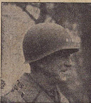
GEN. HODGES—het eerste over den Rijn.

Het nieuws van het centrale Oderfront komt ditmaal uitsluitend via Berlijn en moet dus met een flinke korrel zout worden genomen. Volgens Berlijn zijn de Russen in de offensief over den Oder, benoorden en bezuiden Küstrin. Ze zouden er een stevig bruggehoofd hebben er ondertusschen reeds zijn doorgedrongen tot Seelow, dat in rechte lijn een 60 km. van de Deutsche hoofdstad ligt. Er zouden hier zware gevechten worden geleverd. Volgens vroeger Deutsche berichten zouden de Russen de stad Küstrin, een voornaam bolwerk op den Oostelijken oever van den Oder, reeds gedeeltelijk in handen hebben.