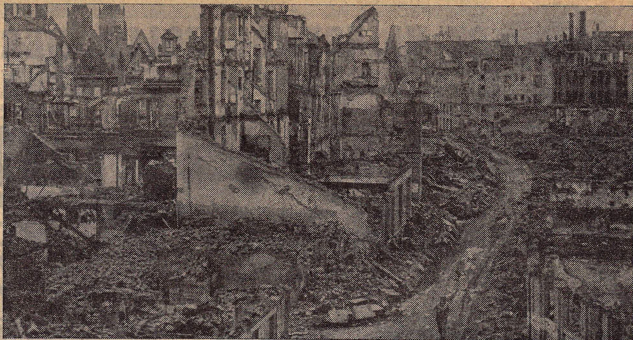
Een eenzame Amerikaansche soldaat loopt door de ruïnes van wat eens Heilbronn was. Er zijn geen Haken-kruisvlaggen meer te zien. . . .