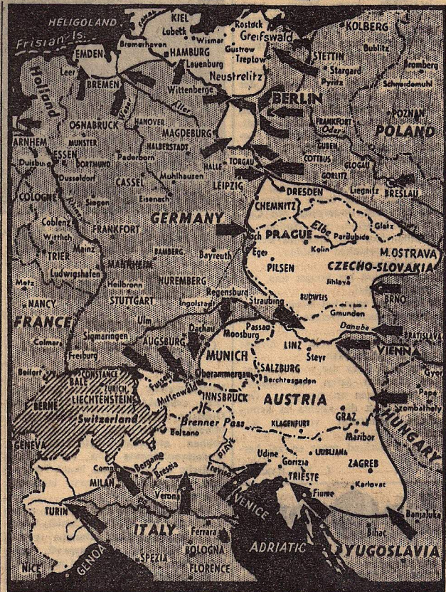
De situatie aan het Westelijk Front, op Dinsdagavond 1 Mei (Daily Mail.)

Ten Noorden van Venetië is Udine in Britsche handen. Nieuw-Zeelandse troepen hebben in de buurt van Triëst een verbinding tot stand gebracht met de Zuidslavische legers van maarschalk Tito.