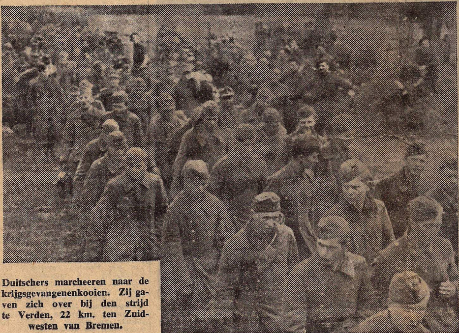
Duitschers marcheeren naar de krijgsgevangenenkooien. Zij gaven zich over bij den strijd te Verden, 22 km. ten Zuidwesten van Bremen.

Vergane glorie Goering—zoo hij nog leeft—is 52 jaar oud. Op 1 September '39, den dag waarop de Duitschers Polen aanvielen, werd hij door Hitler tot zijn opvolger benoemd. Hij was de eenige z.g. Rijksmaarschalk. Na den Wereldoorlog leefde Goering geruimen tijd in Zweden, waar hij als morfist verpleegd werd in een krankzinnigengesticht. Van daaruit vond hij rechtstreeks zijn weg naar de Nazi-beweging. Hij was een van de scheppers van de Luftwaffe, en leidde persoonlijk vanuit Frankrijk enkele zware luchtaanvallen op Londen. In 1915 had Goering zelf leeren vliegen. Hij maakte toen deel uit van het Richthofen-eskader.