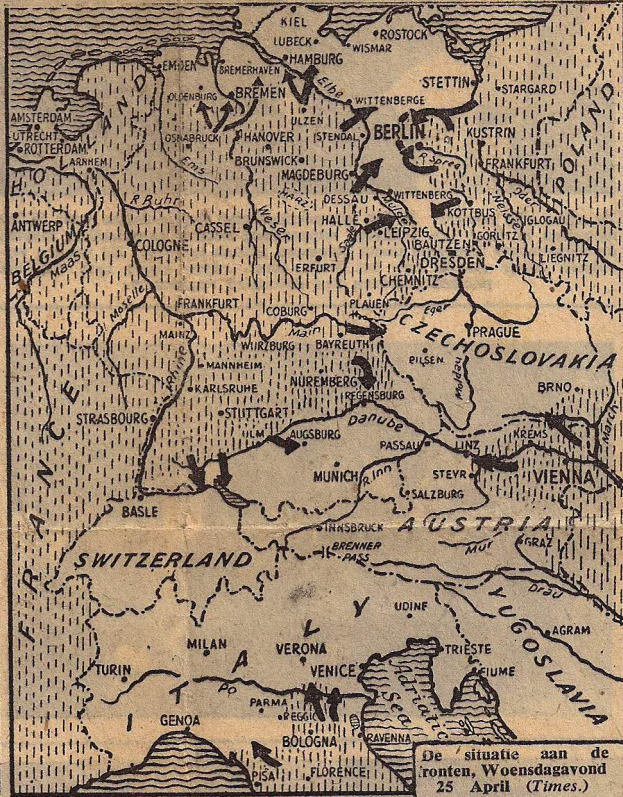
De situatie aan de fronten, Woensdagavond 25 April (Times.)

Berchtesgaden gebombardeerd J.1. Woensdag is de villa van Hitler te Berchtesgaden zwaar gebombardeerd door Lancasters van de RAF, geëscorteerd door Amerikaanse jagers. SS-kazernes werden met den grond gelijkgemaakt. Hitlers verblijf werd door voltreffers in een puinhoop veranderd. Rookwolven stegen tot 3 kilometer hoog op. "Het was de hel op aarde," zei een Britsch waarnemer. Of de duivel er aanwezig was, is onbekend.