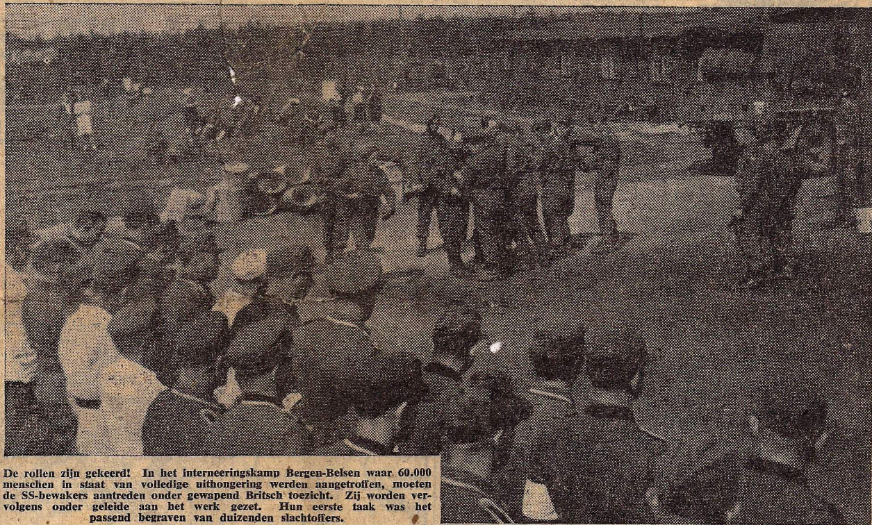
De rollen zijn gekeerd! In het interneringskamp Bergen-Belsen waar 60.000 menschen in staat van volledige uithongering werden aangetroffen, moeten de SS-bewakers aantreden onder gewapend Britsch toezicht. Zij worden vervolgens onder geleide aan het werk gezet. Hun eerste taak was het passend begraven van duizenden slachtoffers.

Donderdag, 26 April. Bremen capituleert. Patton bij Ingolstadt (ten N. van München aan de Donau). Russen veroveren Siemensstadt, Königswusterhausen en Stettin. Verona veroverd. Geallieerden over de Etsch (Adige). Maarschalk Pétain aan de Fransche grens gearresteerd. Maarschalk Goering valt.