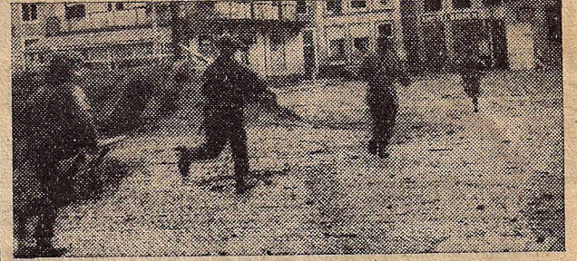
Een herinnering aan den strijd in Vliissingen. Britsche commandos ronnen op een huis toe waar zich Duitsche scherpshutters hebben opgesteld.

Parijs, 20 Nov.—Overeenkomstig het verdrag, dat op 20 September 1944 werd gesloten tusschen de voorloopige Fransche Regering en de Nederlandsche Regering, heeft de Minister van Sociale Zaken in Frankrijk een Missie voor de repatriëring gevestigd. Deze Missie heeft haar kantoor op 109 Boulevard Malesherbes te Parijs, en is al met haar werkzaamheden begonnen.