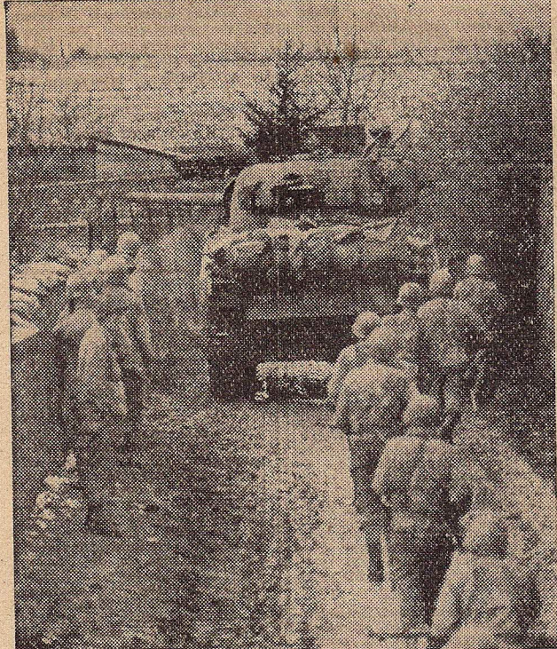
Voor de verovering van Metz. Beschermd door een zware tank naderen Amerikaanse patrouilles behoedzaam de buitenwijken van de vestingstad.

• Een derde opmerking: "Men klaagt dat nog te veel menschen zich na negen uur 's avonds op straat bevinden. Toen de Duitschers de baas waren, volgde men dergelijke bevelen stipt op. De Amerikanen maken ons niet bang, maar ze eischen zelf-discipline, die een waarlijk vrij volk als het onze aan den dag dient te leggen."