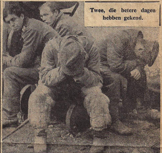
Twee, die betere dagen hebben gekend.

De Tactische Luchtmacht maakt van iedere opklaring in het weer gebruik om de oprukkende troepen te ondersteunen. Het vijandelijke afweervuur is hevig, vooral langs de oevers van den Rijn. De Duitschers gebruiken o.a. treintjes uitgerust met afweerschut er op. De luchtverkenning heeft groote aantallen lichters op den Rijn waargenomen, in het bijzonder op bepaalde veerpunten. Een eerste Duitse poging om troepen in Oostelijke richting over den Rijn te brengen, werd onmiddellijk met een felle beschieting door de Geallieerde jager - bommenwerpers beantwoord.