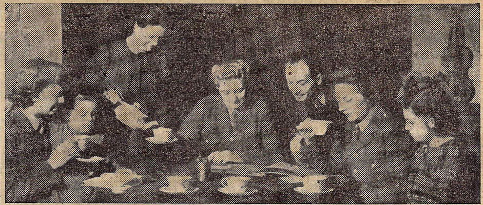
Drie meisjes van de ATS (het Engelse vrouwenhulpkorps van het leger), op bezoek bij een familie in bevrijd gebied. Overal worden de bevrijders met groote hartelijkheid ontvangen.

Zaterdag, 3 Febr. —Goede Amerikaanse voortgang in Siegfriedlinie. 1.000 Amerik. bommenwerpers teisterden hart van Berlijn. 400 Liberators bombardeerden benzine-fabriek bij