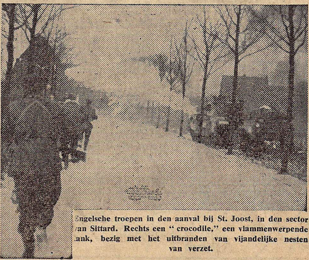
Engelse troepen in den aanval bij St. Joost, in den sector van Sittard. Rechts een "crocodile," een vlammenwerpende ank, bezig met het uitbranden van vijandelijke nesten van verzet.

• In de "Cineac" te Eindhoven werd een filmreportage vertoond van den beroemden tocht van een Engelsch convooi naar Malta, in Augustus 1942.